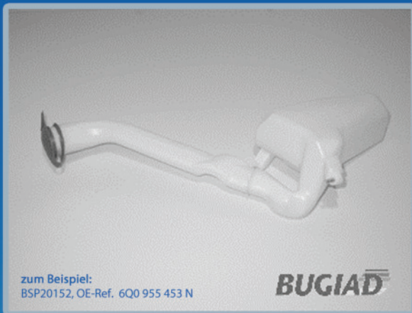
zum Beispiel: BSP20152, OE-Ref. 6Q0 955 453 N