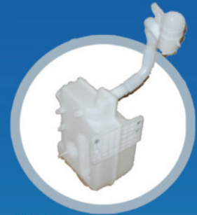
zum Beispiel: BSP20155, OE-Ref. 1K0 955 453 S