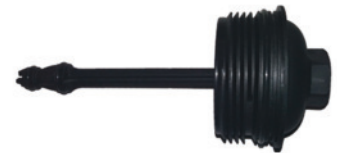
zum Beispiel: Art-No.: BSP24780 OE-No.: 03L 115 433